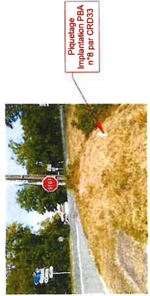
Piquetage Implantation PBA n°8 par CRD33