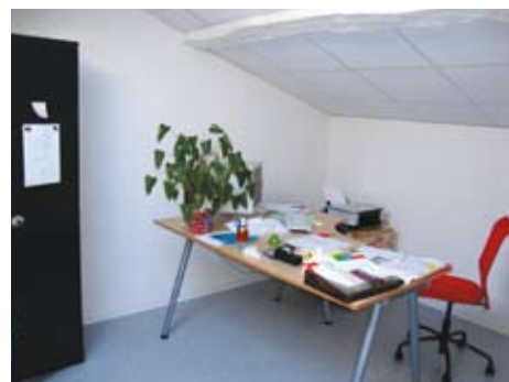
Le bureau de la direction

La réfection de la garderie a permis de réaménager l'espace et de doubler la surface d'accueil, mais elle a également permis la réalisation d'une salle des professeurs et d'un bureau de direction plus vastes, plus lumineux, plus agréables à utiliser.