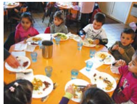
Nos petits bouts attablés devant leur assiette, ils n'en perdent pas une miette