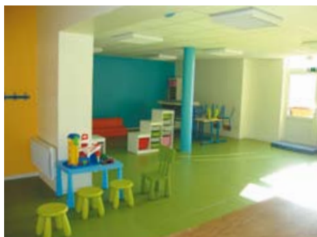
La garderie espace jeux

Pas facile de faire du vieux avec du neuf, mais c'est le pari réussi de la municipalité grâce à une équipe d'artisans professionnels et un cabinet d'architecte à l'écoute et soucieux de répondre aux attentes et aux besoins des activités de l'école.