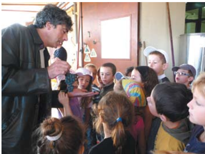
Journée à Montagne St Emilion : Les classes de CP et CE2 participent aux vendanges au lycée agricole de Montagne St Emilion. L'après-midi : participation à un atelier dégustatif, visite de l'écomusée et travail sur la vigne.