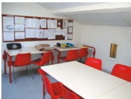
La salle des professeurs