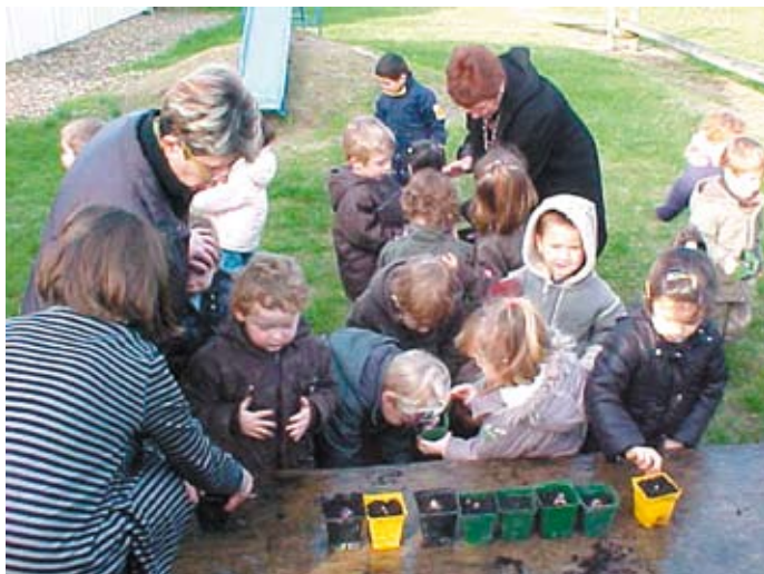
Petite section - Dans le cadre du projet d'école, les petits font leur première plantation