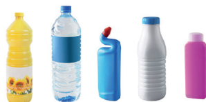
Bouteilles et flacons

+ À partir du 1 er janvier 2023 tous les emballages en plastique et les petits emballages en métal