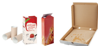
Emballages en carton et briques alimentaires