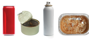
Emballages en métal