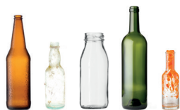
Bouteilles en verre Bocaux